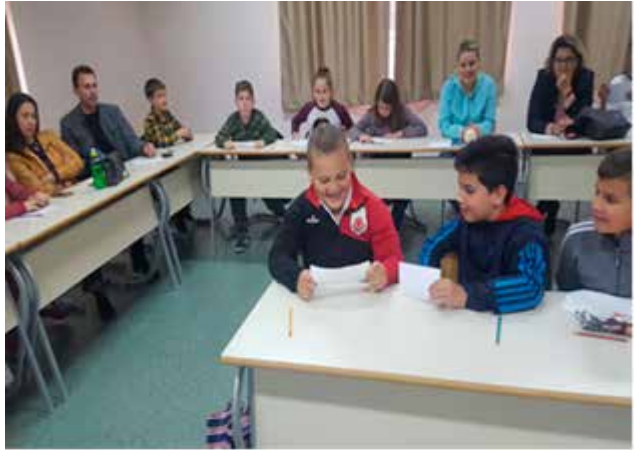
Aktivnosti Akcionog plana u Srednjobosanskom kantonu