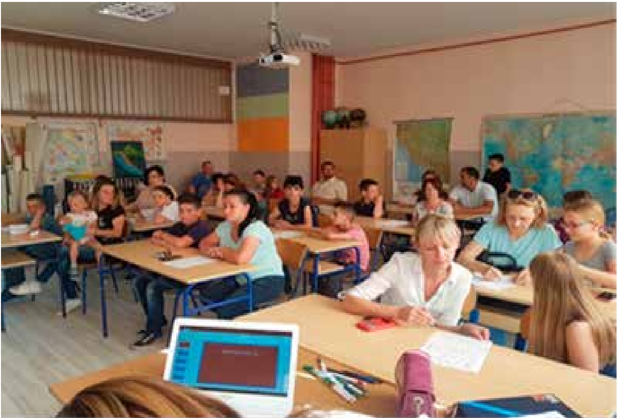
Radionice sa roditeljima i učenicima u Kantonu Sarajevo