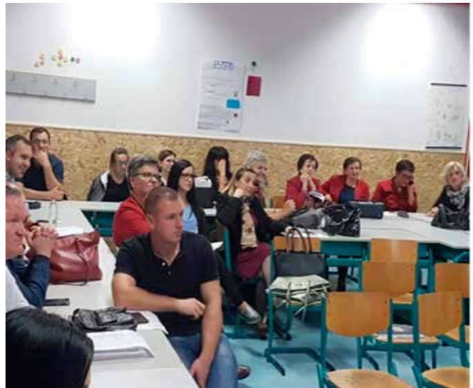
Aktivnosti Akcionog plana u Hercegovačko – neretvanskom kantonu